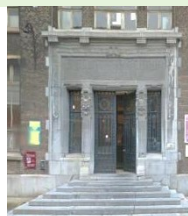
Entrée rue Lebeau

Rues avoisinantes, place du Manège, Palais des Expositions (compter 5 min à pied)